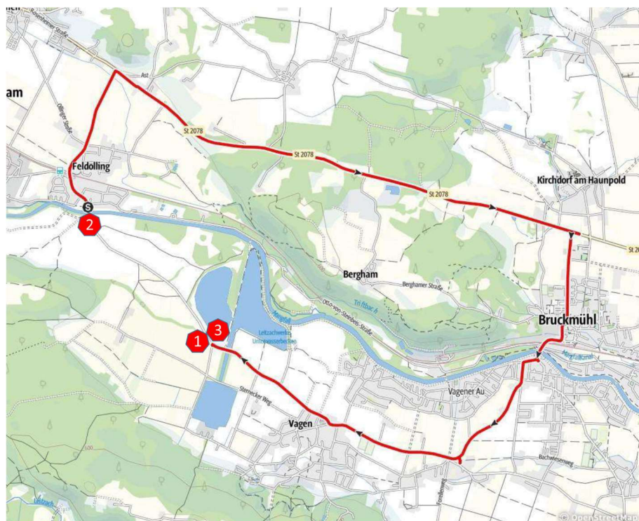
Abb. 1: Umfahrung während der Sperrzeiten der Kreisstraße RO13 beim HRB Feldolling

Ort – Feldolling (Gemeinde Feldkirchen-Westerham)